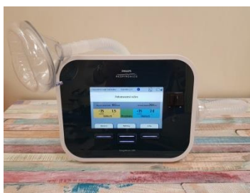
Obrázek 1. Přístroj CoughAssist – aplikace přes obličejovou masku

Dalším specifickým přístrojem CoughAssist E70 je možnost pracovat v oscilačním režimu, který se využívá pro snazší odlepení sekretu a zlepšení jeho mobilizace (Obrázek 2). Lze jej aktivovat jak v manuálním, tak i v automatickém režimu a může být nastaven při nádechu, výdechu i v obou fázích (31). Výhodou je i možnost ovládní přístroje pomocí nožního pedálu v případě, kdy nelze na přístroji u nemocného použít automatický režim a terapeut potřebuje pro aplikaci masky využít obě ruce (často v případech, kdy se jednou rukou např. stabilizuje správná poloha hlavy apod.).