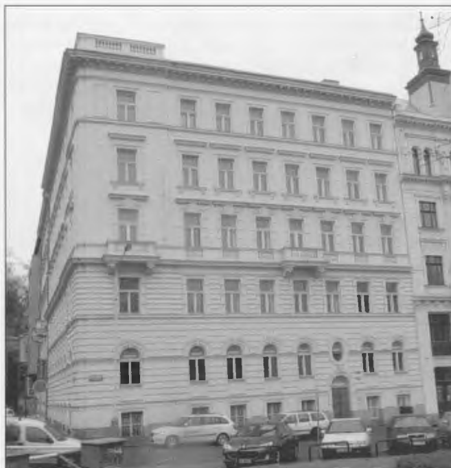
Obrázek archiv autora

V roce 1925 zhodnotila Liga prvních pět let své existence obsáhlým výčtem svých dosavadních aktivit, jejichž přehled uvádíme ve stručném výběru (Jubilejní 1919–1925). V tomto období bylo zřízeno celkem 193 místních, okresních, resp. krajských „odborů“, jejichž činnost byla průběžně hodnocena na výročních sjezdech a publikována v odborném i občanském tisku. Pokusy o spolupráci s německým Landeshilfsverein für Lungenkranke vyzněly však neúspěšně a naopak, německé spolky utvořily samostatný Gesamtverband für Lungenkranke , který kontakty s MLPT neudržoval. Byl vydáván Věstník MLPT , v edici odborných publikací vycházely odborné příručky, ve stotisícových nákladech byly vydány propagační letáky a plakáty, byly organizovány putovní výstavy, pracovníci Ligy přednesli více než 1 000 výchovných přednášek provázených diapozitivy a byl vytvořen také první český šestidílný výukový film o TBC. Pro odborné pracovníky oboru TBC byly organizovány odborné kurzy a pro školení sester a sociálních pracovníků byla pořádána odborná školení. Liga rozvíjela mezinárodní spolupráci – stala se členem Mezinárodní unie proti TBC v Paříži, její reprezentanti se účastnili světových kongresů v Bruselu a v Lausanne, byly navázány kontakty s americkou asociací pro TBC a dalšími zahraničními společnostmi a Liga také zprostředkovala účast spolupracujících