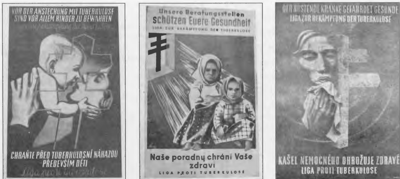
Obr. č. 2: Náborové plakáty Masarykovy ligy proti tuberkulóze z období Protektorátu Čechy a Morava

se na vydávání Rozhledů podílela společně s Ligou také Čs. společnost pneumologická a ftiseologická, která poskytovala Rozhledy i Boj proti tuberkulóze svým členům bezplatně v rámci členského příspěvku, který činil ročně 150 Kčs. Po zrušení Ligy v roce 1950 vycházely Rozhledy jako publikační orgán Pneumologicko-ftiseologické společnosti a po změně jejich názvu na Studia pneumologica et phthiseologica se jejich více než 70 ročníků stalo publikačním a informačním orgánem několika generací pneumoftizeologů i jiných odborníků.