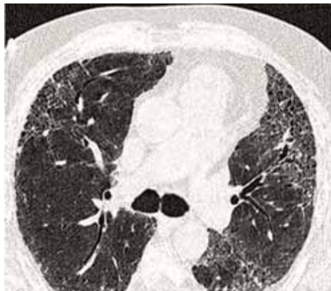
Obrázek 3. CT s vysokou rozlišovací schopností u pacienta s plicní fibrózou. Bílé okrsky znamenají jizevnatě změněnou plicní tkáň