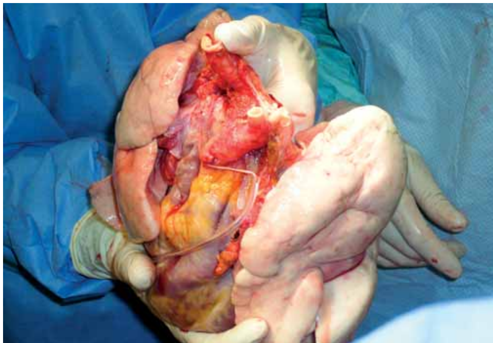
Obrázek 6. Blok srdce a plic připravený po odběru od dárce k transplantaci do pohrudniční dutiny příjemce