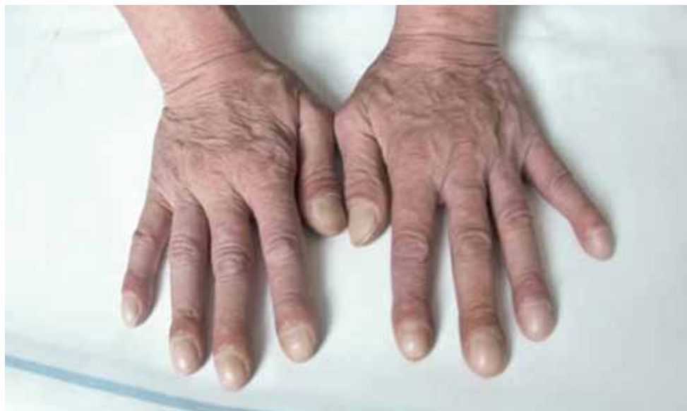
Obrázek 1. Paličkovité prsty s nehty tvaru hodinových sklíček

Klinicky se většina IPP projevuje narůstající námahovou a posléze klidovou dušností, snadnou unavitelností, kašlem a v pozdějších fázích při nastupujícím nedostatečném oksyličení (hypoxémii) i cyanózou (fialovým zbarvením kůže a sliznic). U některých IPP se také vyskytují mimoplicní projevy, jako jsou paličkovité prsty s nehty tvaru hodinového sklíčka (obrázek 1). Při vyšetření plic poslechem pomocí fonendoskopu poslouchá lékař drobné chrůpky (krepitus) slyšitelné nad dolními částmi plic. Jestliže se IPP vyskytují v rámci systémových onemocnění, mohou se objevit klinické projevy postižení kůže, kloubů a jiných orgánů. Většinou jsou nápadné některé typické projevy kolagenóz (onemocnění pojivové tkáně), jako jsou radiální rýhy kolem úst a sklerodaktylie (ztuhnutí a ztenčení kůže nad posledními články prstů) u systémové sklerodermie, zarudnutí kůže s bolestivým otokem u dermatomyozitidy, projevy suchosti v ústech, zvýšená kazivost zubů a pálení očí u Sjögrenova syndromu a Raynaudův fenomén (bolestivé zblednutí a následné zfialovění rukou, popřípadě nohou, většinou po vystavení chladu) společný pro řadu systémových vaskulitid. Vykašlávání krve a krvavě zbarvená moč bývá typickým projevem hlavně u tzv. Goodpastureova syndromu, kdy se tvoří protilátky proti stěně plicních sklípků a klubíčkům kanálků v ledvinách.