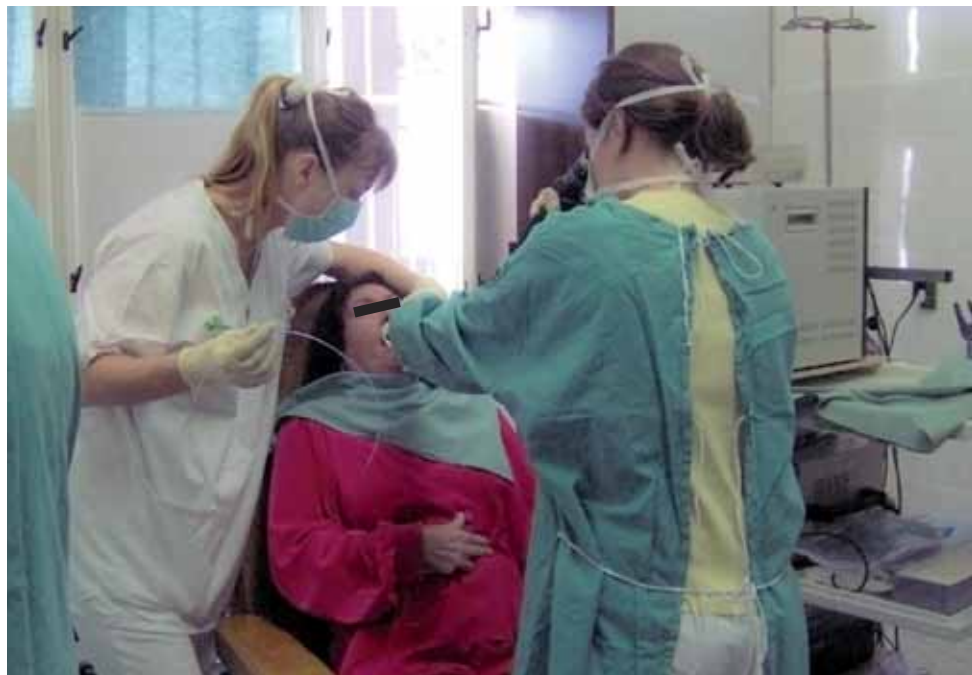
Obrázek 4. Praktické provedení bronchoskopického vyšetření vsedě v místním znecitlivění

Bronchoskopie je vyšetření, které se standardně používá pro určení diagnózy IPP včetně idiopatické plicní fibrózy. Provádí se ohebným bronchoskopem, tenkou ohebnou hadičkou s optickými vlákny (fibrobronchoskop) nebo malou kamerou (videobronchoskop) a pracovním kanálem. Obvykle se vyšetření provádí v místním znecitlivění, kdy jsou krk a průdušnice vystříkány roztokem anestetika (Lidocain, Tetracain), buď formou inhalace, nebo rozprašovači (obrázek 4). Tím dosáhneme znecitlivění horních částí dýchacích cest, abychom mohli zavést bronchoskop do průdušek a provést odběry na různá vyšetření mikrobiologická, cytologická a histologická (obrázek 5). Odebírá se materiál jednak cévkou, jehlami a pak také klíšťkami, kdy se získávají malé vzorky