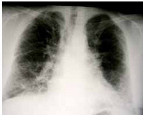
Obrázek 2 Zadopřední skiagram hrudníku u pacienta s plicní fibrózou s nápadných síťováním v dolních plicních partiích, které je obrazem jizevnatých změn v plicích.

Základem zobrazení je prostý zadopřední skiagram hrudníku (běžný „rentgen“), ale podstatně více informací o postižení plic při IPP nám podává výpočetní tomografie hrudníku s vysokou rozlišovací schopností (HRCT) (obrázky 2 a 3). Mezi změny, které můžeme pozorovat u IPP na skia-gramu hrudníku, patří: změny velikosti plicních polí, obraz drobných uzlíků a proužkovitých stínů,