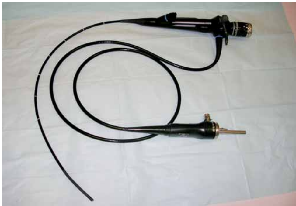
Obrázek 5. Ohebný bronchoskop – fibrobronchoskop

plicní tkáně přímo pro histologické vyšetření pod mikroskopem ( transbronchiální biopsie plic ). Klíšťkami získáváme vzorky plicní tkáně o průměru cca 2 mm. Dále se provádí bronchoalveolární laváž (BAL) , kdy se vyplachuje okresek plicní tkáně vlažným fyziologickým roztokem a tekutina se získanými buňkami pak nasává zpět do stříkačky a posílá na vyšetření. Množství vstříkované tekutiny se liší v rozmezí 100–300 ml a dle toho se liší počet porcí tekutiny (3–5 porcí). Při cytologickém hodnocení tekutiny získané tímto výplachem (BALT) zaznamenáváme počet buněk, jejich typ a buněčnou stavbu. Za normálních okolností se v BALT setkáme s naprostou převahou (90%) tzv. makrofágů (buněk zodpovídajících za očistu plic a zpracování cizorodých částic pro další kroky obranných reakcí), 10% buněk tvoří lymfocyty (buňky již přímo spouštějící a organizující obranné reakce). Pro idiopatickou plicní fibrózu je v BALT typické zvýšení jednoho z podtypů bílých krvinek, a to tzv. granulocytů, v případě exogenní alergické alveolitidy pak najdeme obvykle zmnožené jiné bílé krvinky – lymfocyty. Někdy hodnotíme v BALT i nebuněčné součásti, například proteiny, lipoproteiny a prachové částice (azbestová tělíška). V případě IPP spojených s krvácením do plicních sklípků je BALT zbarvena buď čerstvou krví, nebo hnědavě, v závislosti na časovém odstupu od krvácení.